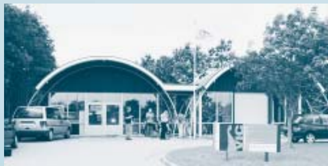
Viking Informatiecentrum Den Oever op Wieringen.