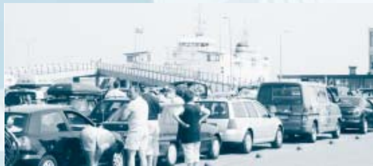
Overtocht Texel - Den Helder, TESO.