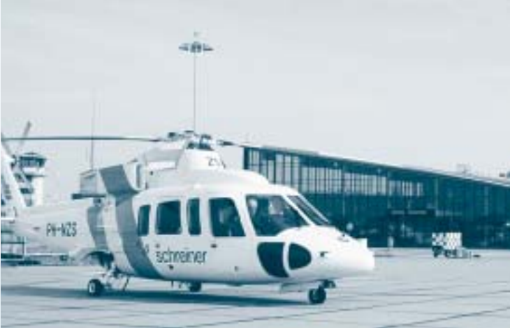
Den Helder Airport.

van deze ontwikkelingen is dat, ondanks de huidige recessie, de bestedingen voor toerisme en recreatie gestaag toenemen. Omdat het om relatief arbeidsintensieve dienstverlening gaat, creëert deze sector de nodige nieuwe banen. Daarnaast zijn er positieve indirecte economische effecten, zoals het behoud van draagvlak voor winkelvoorzieningen in kleine kernen.