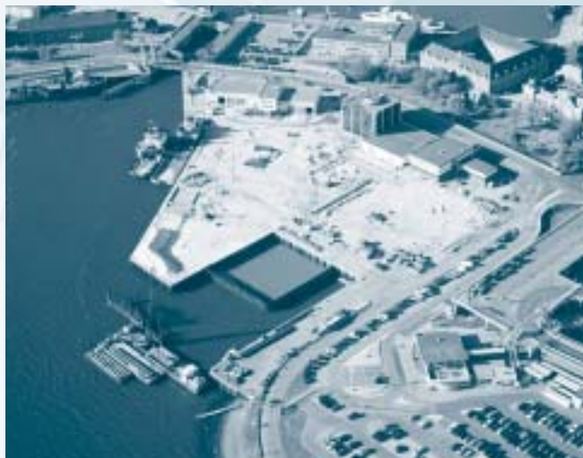
Deel van het havengebied in Den Helder