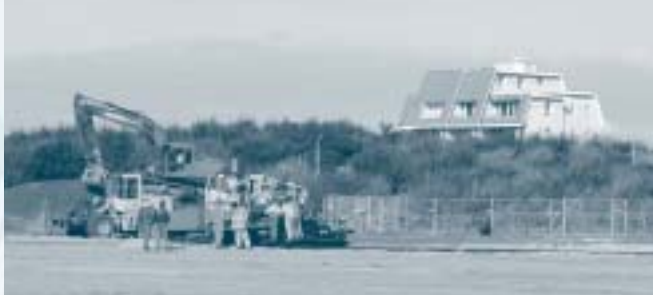
Centrumontwikkeling Groote Keeten, parkeerplaats is in januari 2004 opengesteld.