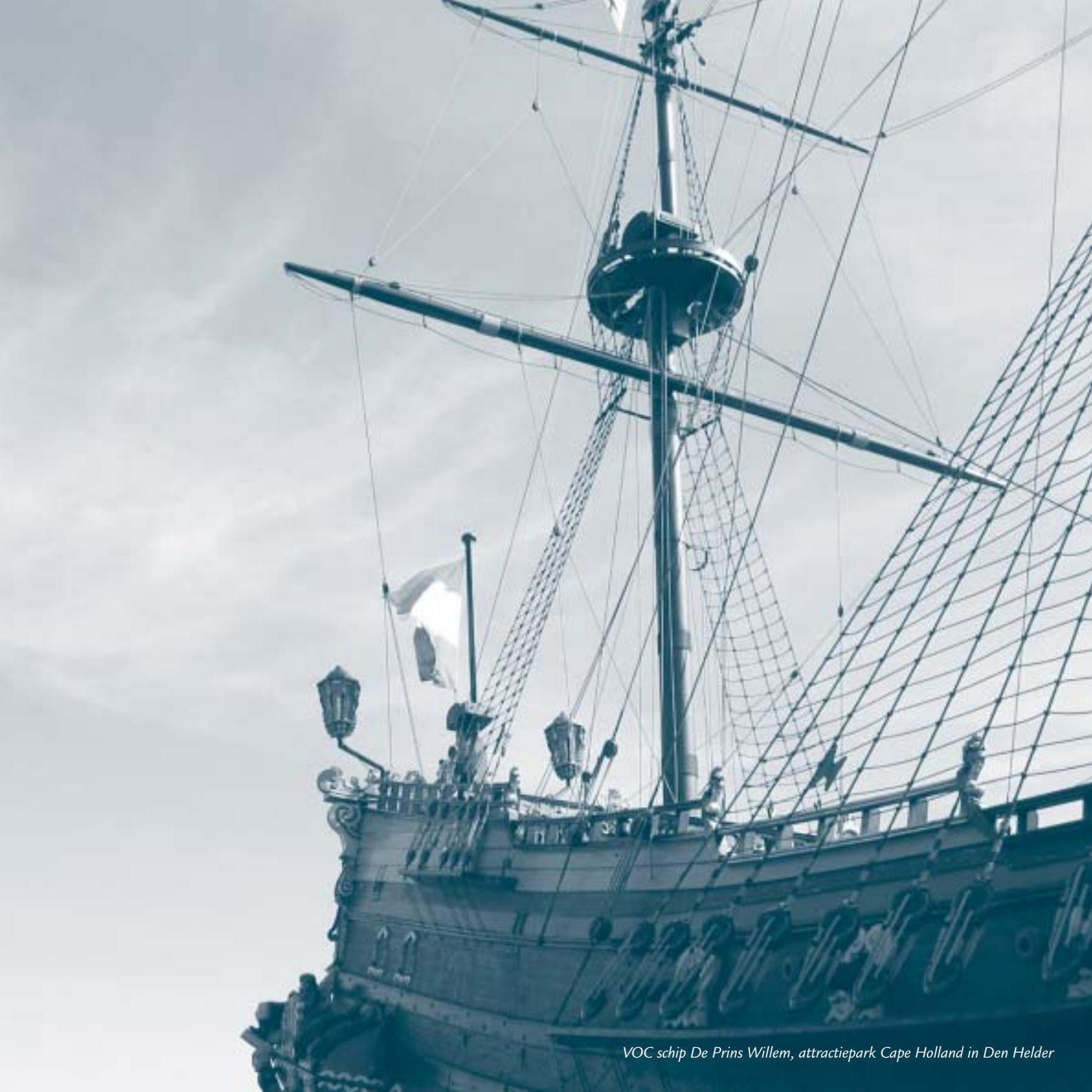
VOC schip De Prins Willem, attractiepark Cape Holland in Den Helder