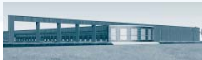
Locatie van het nieuwe agribusinesscomplex aan de A7.