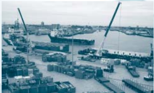
Den Helder Offshore Service and Logistics Centre.