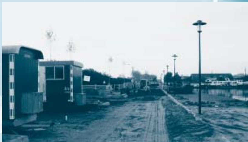
Haven Lagedijk in Schagen, herinrichting oostzijde van de kade.

De Kop van Noord-Holland heeft toeristen en recreanten veel te bieden: zon, duinen, strand, ruimte, natuur en cultuur. Velen uit binnen- en buitenland weten de weg naar de Kop te vinden voor een dagje uit of een meerdaags verblijf. Toerisme en recreatie vormen een ware groeiemarkt. De toenemende welvaart, vrije tijd en mobiliteit zijn de drijvende kracht achter deze groei. Het resultaat