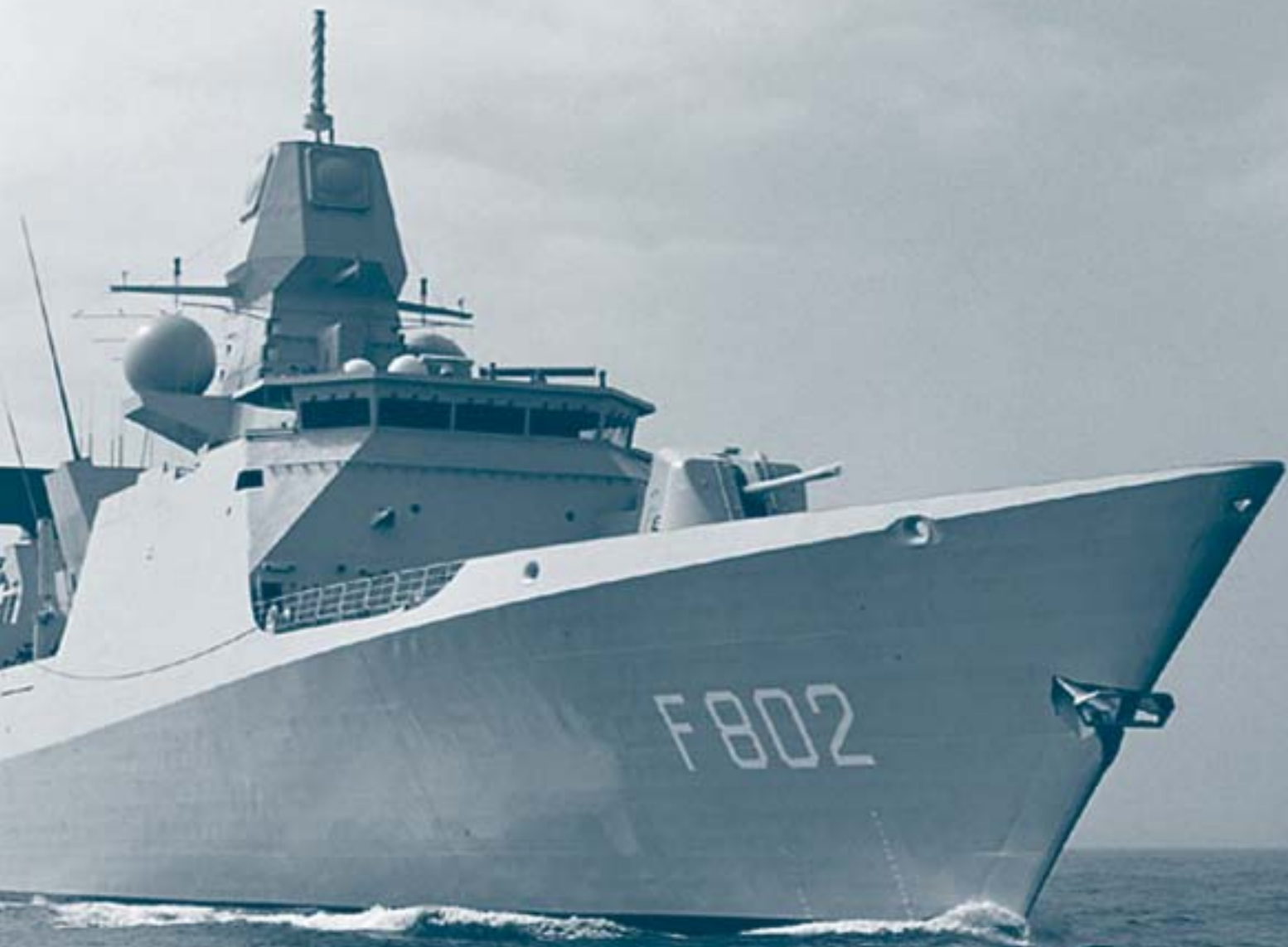
Fregat De Kikker van de Koninklijke Marine